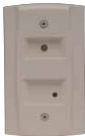
RTS151 UL S4011

System Sensor brinda flexibilidad al sistema, con una variedad de accesorios que incluyen dos estaciones de prueba remota y varios medios diferentes de anunciación visible y audible. Tal como nuestros detectores de humo para ductos, los accesorios tienen listado UL.