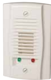
APA151 UL S4011