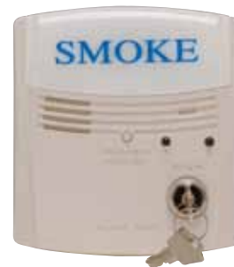
RTS2-AOS UL S2522