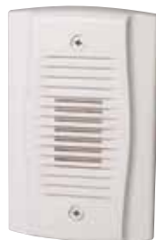
MHW UL S4011