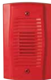
MHR UL S4011