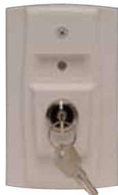
RTS151KEY UL S2522