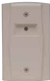
RA100Z UL S2522